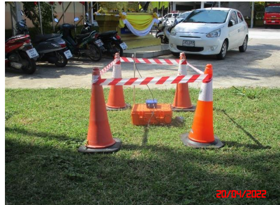
บ้านดอนบน