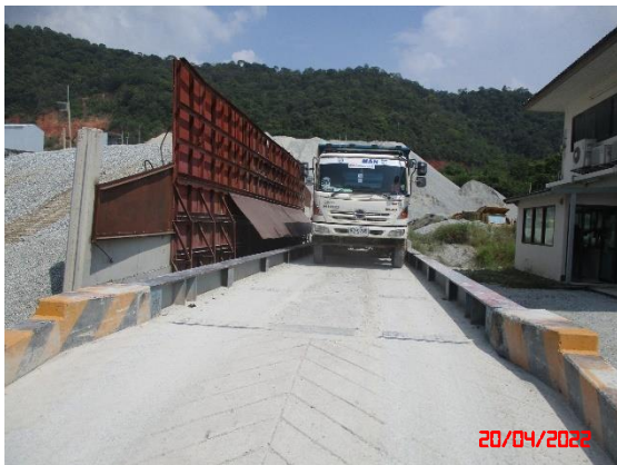
จุดขนถ่ายแร่บรรทุกทุกแร่