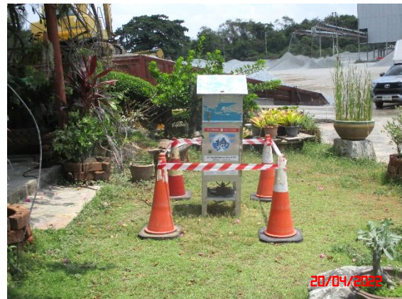
สำนักงานโรงโม่หินผลิตภัณฑ์ศิลาแสนสุข