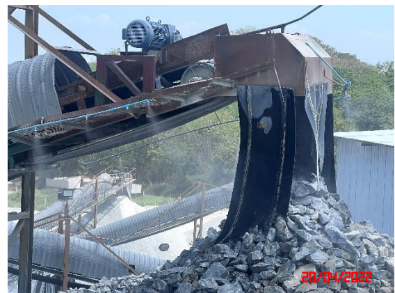
อุ้งครอบปลายสายพานลำเลียง