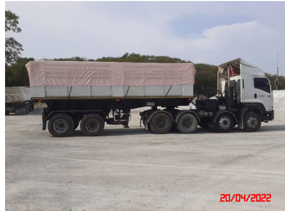
การปิดคลุมผ้าใบรถบรรทุก