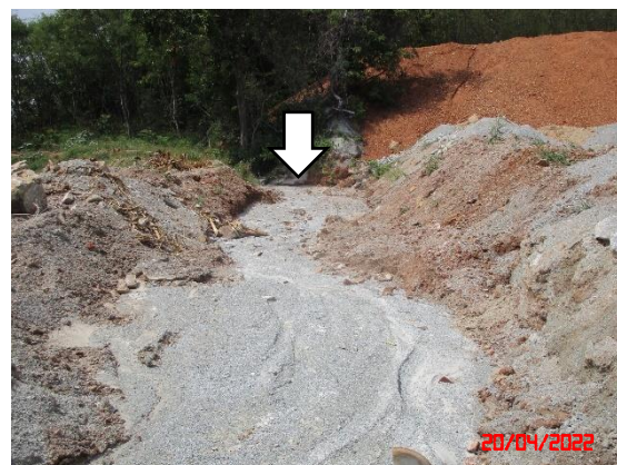
คูระบายน้ำ