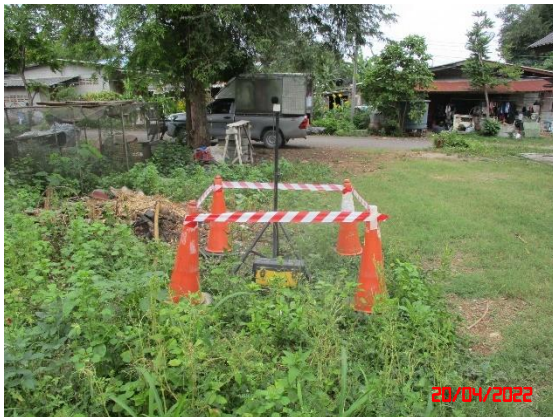
ชุมชนบ้านดอนกลาง