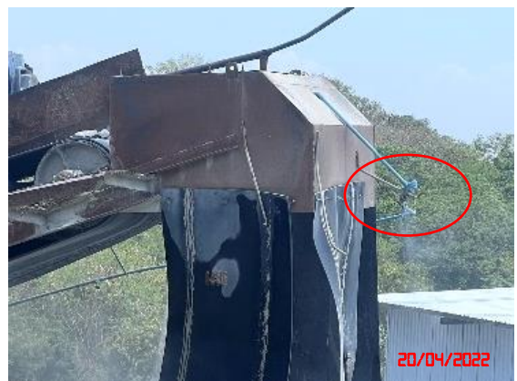
ระบบสเปรย์น้ำ