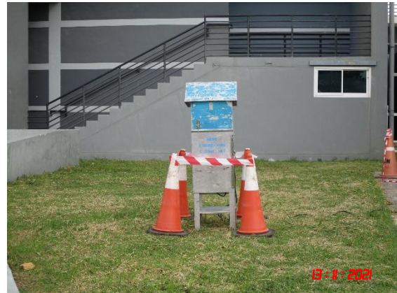
บ้านดอนบน