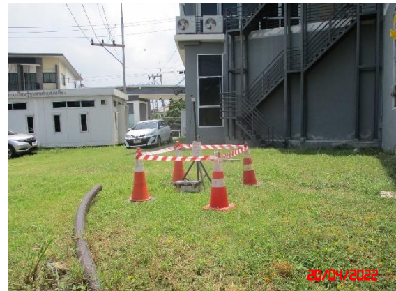
บ้านดอนบน