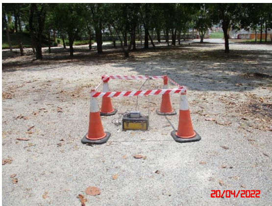
วัดหน้าเขาบ่อยาง