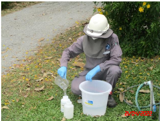
น้ำบ่อต้นบ้านดอนกลาง