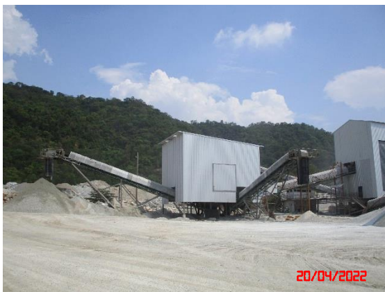
อาคารปิดคลุมโรงโม่หิน