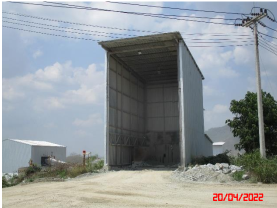
อาคารปิดคลุมยังรับหินใหญ่