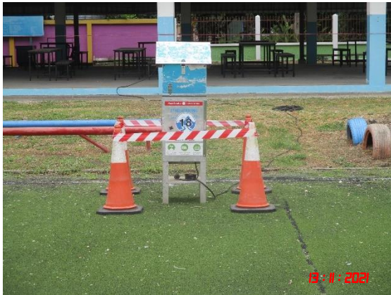
ชุมชนบ้านไร่ไหหลำ