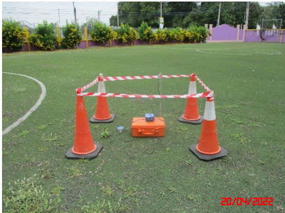
บ้านไร่ไหล่า