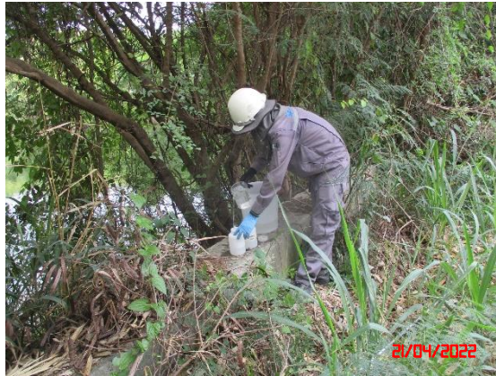
สระน้ำบ้านดอนกลาง