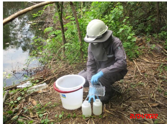
สระน้ำบ้านดอนบน