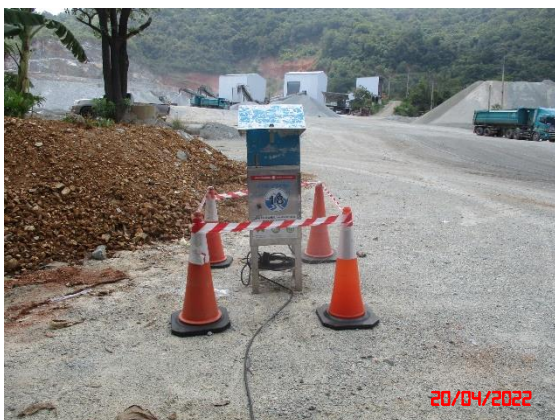
สำนักงานโรงโม่หินของโครงการ