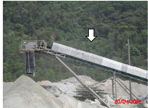
หลังคาปิดคลุมสายพานลำเลียง