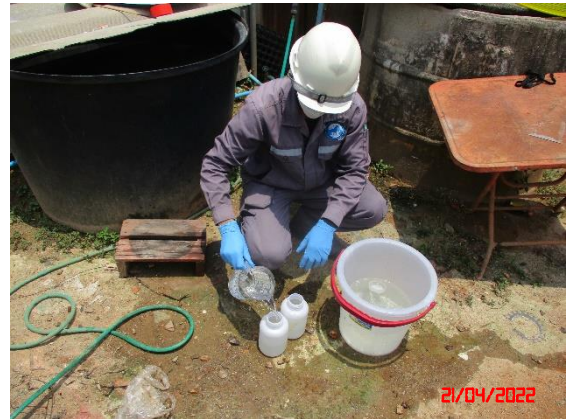
น้ำบ่อต้นบ้านดอนบน