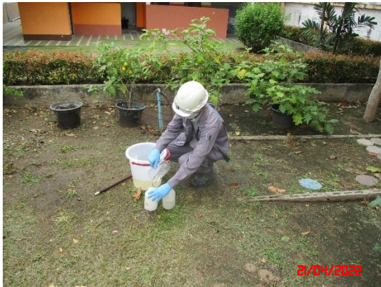
น้ำบ่อต้นบ้านไร่ไหลลำ