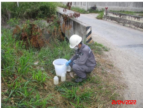
คลองบางโปร่ง