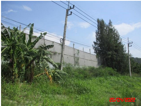
แนวต้นไม้รอบโรงโม่หิน