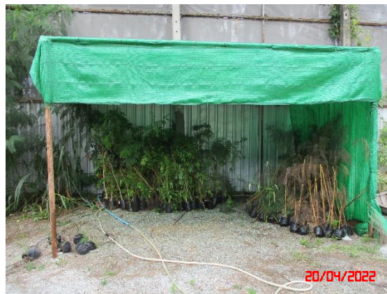
กล้าไม้ที่จัดเตรียมไว้