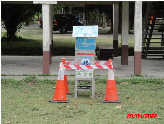
วัดหน้าเขาบ่อยาง