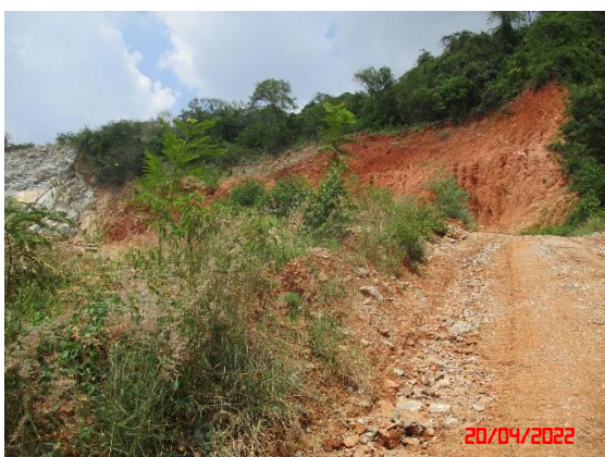
รูปที่ 2-5 แนวต้นไม้บนคั่นทำนบดิน