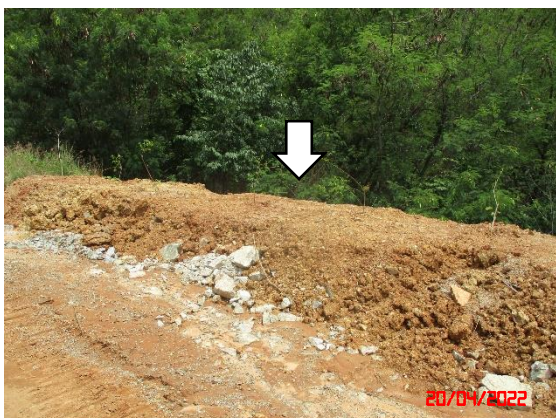
คั่นทำนบดิน