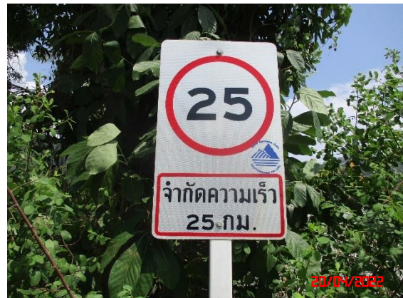
ป้ายจำกัดความเร็ว