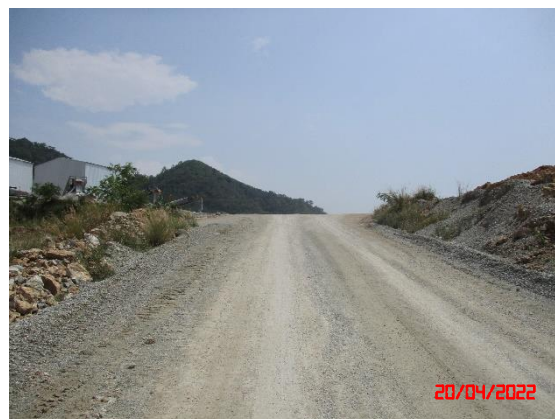
รูปที่ 2-4 คั่นทำนบดิน และคูระบายน้ำ