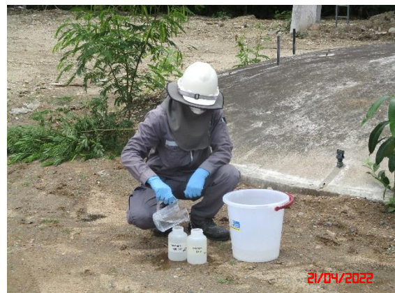
น้ำบาดาลบ้านดอนบน