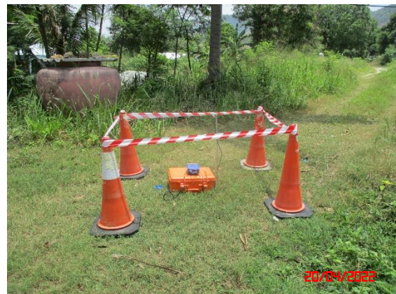
บ้านดอนกลาง