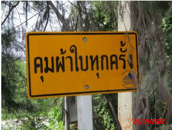
ป้ายเตือนให้ปิดคลุมผ้าใบ