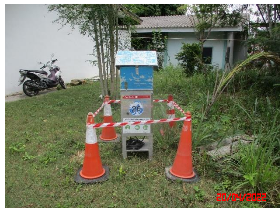
ชุมชนบ้านดอนกลาง