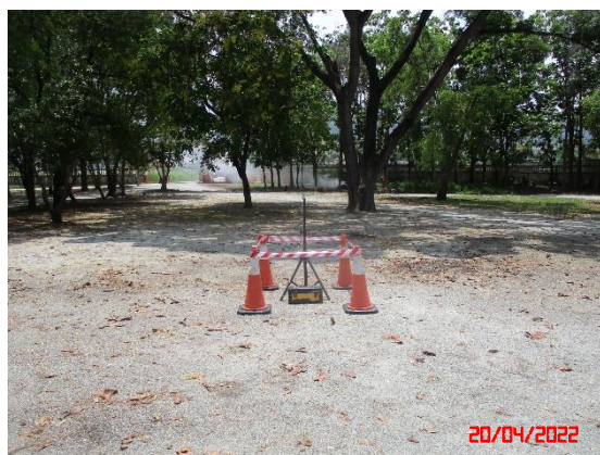
วัดหน้าเขาบ่อยาง