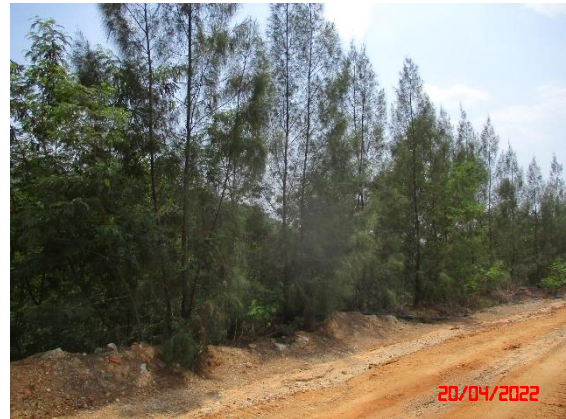
แนวต้นไม้ตามขอบประทานบัตร